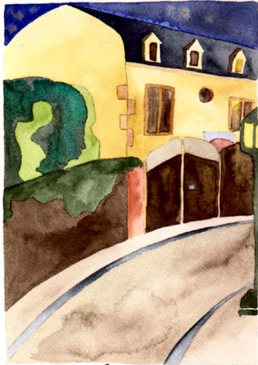
Le Vésinet Yann Gourvennec une nuit de l'été.